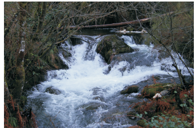
Fervenzas de Verís

Unha ruta no concello de Irixoa para coñecer varias fervenzas no río Zarzo e o seu afluente Rego das Moas.