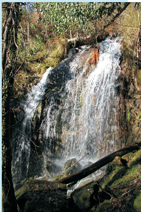
Fervenza de Mántaras

No rego das Moas, afluente do Zarzo, en Mántaras (Irixoa). COMO CHEGAR: na saída de Follente cara a Vigo. Onde se cruza o río hai unha pequena, por enriba da estrada e unha máis grande un pouco máis abaixo. Para vela hai que baixar polo monte, antes de cruzar o río, por onde se poida seguindo o ruído.